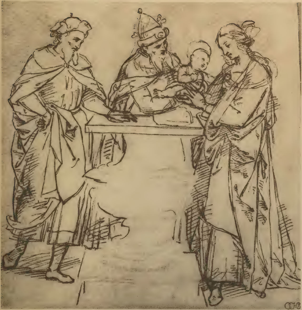
Esquisse pour la Présentation au Temple